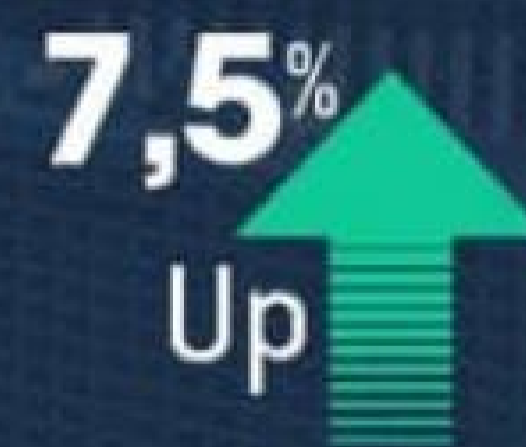
Revenue per Available Room (RevPAR)

Turismo ta e driver principal di nos economia!